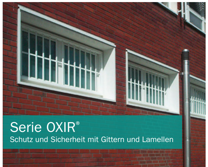
Serie OXIR® Schutz und Sicherheit mit Gittern und Lamellen