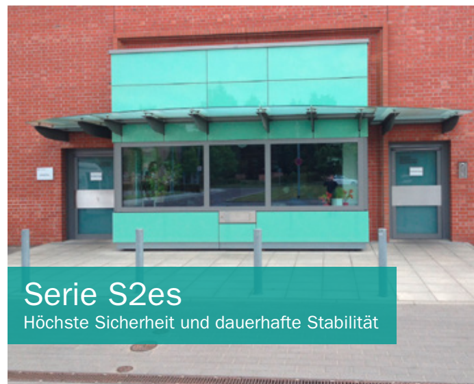
Serie S2es Höchste Sicherheit und dauerhafte Stabilität