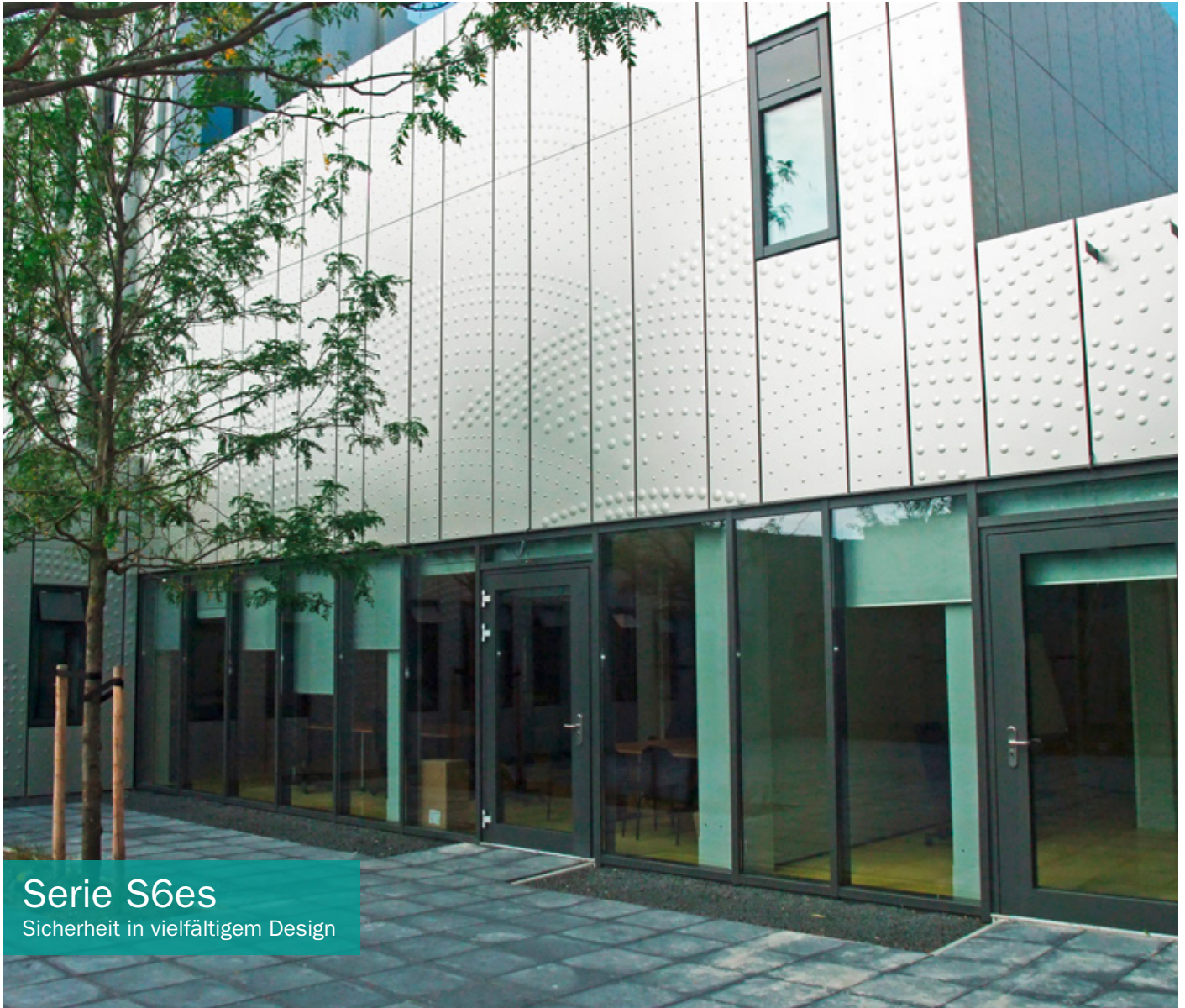
Serie S6es Sicherheit in vielfältigem Design