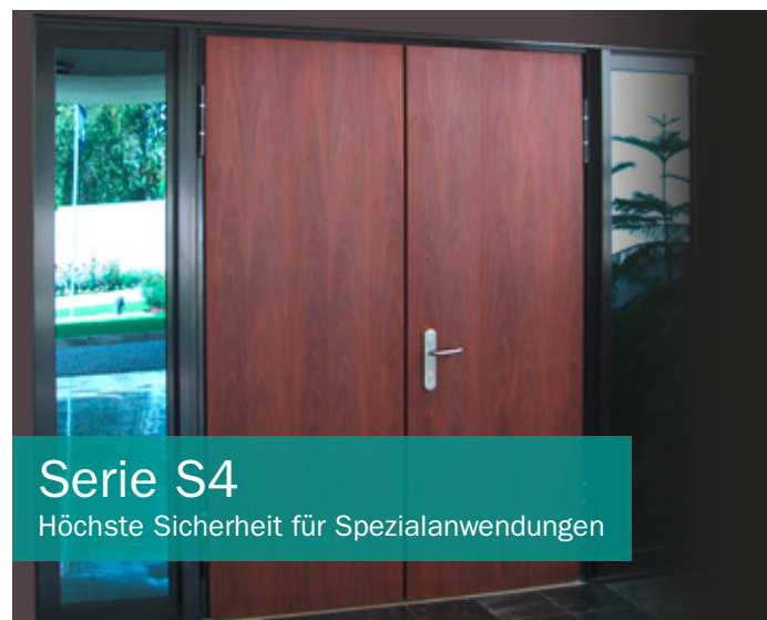
Serie S4 Höchste Sicherheit für Spezialanwendungen