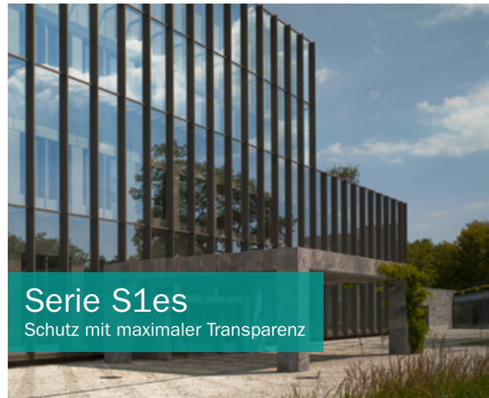
Serie S1es Schutz mit maximaler Transparenz