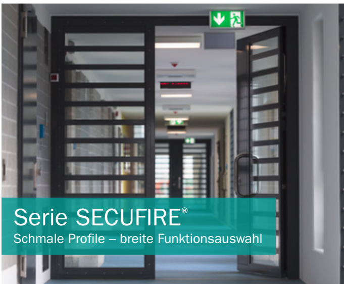
Serie SECUFIRE® Schmale Profile – breite Funktionsauswahl